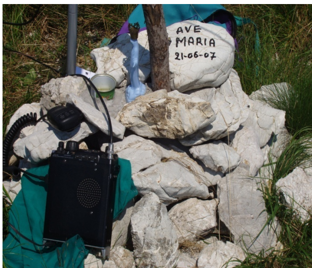
Monte Brancot prealpi Carniche 08/07/2007